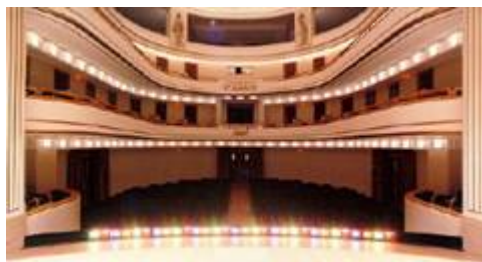
L'interno del Teatro Titano

San Marino, proprio per la sua posizione e le sue caratteristiche, può rappresentare un importante polo di attrazione congressuale ed ospita spesso meeting di prestigio in varie strutture, pubbliche e private. In questo numero della newsletter presentiamo un Teatro del centro storico, che grazie alla sua posizione a pochi passi da numerosi alberghi e ristoranti è particolarmente idoneo allo svolgimento di congressi ed altri tipi di eventi.